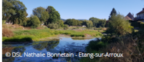
© DSL Nathalie Bonnetain - Etang-sur-Arroux