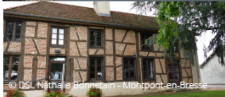
© DSL Nathalie Bonnetain - Montpont-en-Bresse