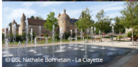
© DSL Nathalie Bonnetain - La Clayette