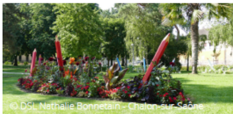
© DSL Nathalie Bonnetain - Chalon-sur-Saône