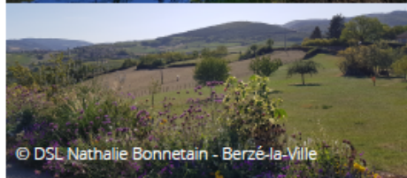
© DSL Nathalie Bonnetain - Berzé-la-Ville