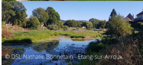
© DSL Nathalie Bonnetain - Etang-sur-Arroux