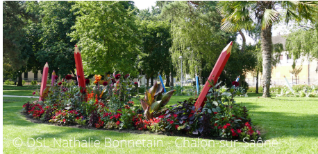
© DSL Nathalie Bonnetain - Chalon-sur-Saône