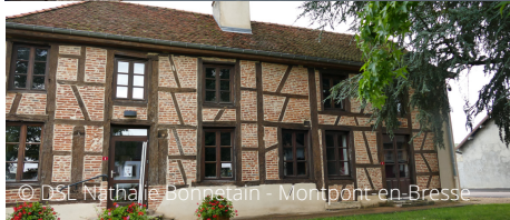
© DSL Nathalie Bonnetain - Montpont-en-Bresse