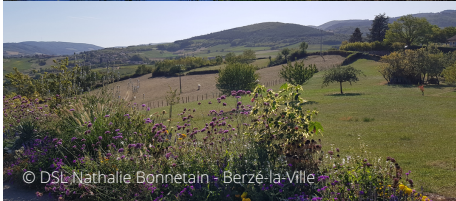
© DSL Nathalie Bonnetain - Berzé-la-Ville