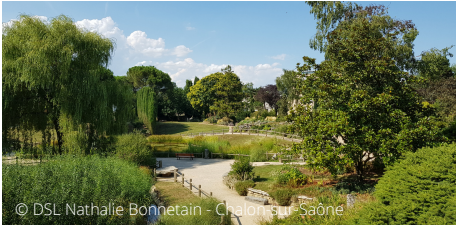
© DSL Nathalie Bonnetain - Chalon-sur-Saône