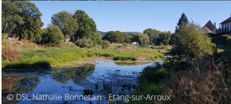
© DSL Nathalie Bonnetain - Etang-sur-Arroux